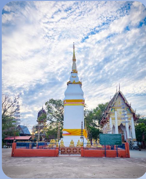
ภาพปก: พระธาตุโพนทัน หรือ (ระงิมคำ)

เป็นพระธาตุที่เก่าแก่คู่บ้านคู่เมืองของตำบลโพนทันมาช้านาน เป็นที่สักการะบูชาของชาวบ้านในตำบลโพนทัน และตำบลใกล้เคียง ในจังหวัดยโสธร สันนิษฐานว่าสร้างขึ้นในปี พ.ศ. ๐๘-๑๐ หลังการสร้างองค์พระธาตุพนมแล้วเสร็จ โดยกลุ่มคนที่เดินทางมาจากฝ่ายใต้ คือดินแดนอีสานใต้ นำสิ่งของที่ศักดิ์สิทธิ์มีค่าทางด้านความเชื่อไปบรจจุไว้ใ้องค์พระธาตุพนม แต่ไม่ทันเนื่องจากองค์พระธาตุพนมได้สร้างเสร็จก่อน กลุ่มคนเหล่านั้นจึงได้พร้อมใจกันสร้างพระธาตุไว้ ณ บริเวณนี้ โดยการดำเนินการของเจ้าเมืองฝ่ายใต้ น่าจะสร้างและมีอายุใกล้เคียงกับธาตุถาดทองหรือธาตุกล่องข้าวน้อย ที่บ้านตาดทอง และพระธาตุภูจาน ที่บ้านภูจาน เป็นพระธาตุคู่บ้านคู่เมืองที่ชาวตำบลโพนทันและชุมชนใกล้เคียง เคารพบูชาในความศักดิ์สิทธิ์มาตั้งแต่ครั้งอดีตจนถึงปัจจุบัน ในปี 2485 พระธาตุได้พังลง เนื่องจากฝนตกหนักเกิดน้ำท่วมใหญ่และได้บูรณปฏิสังขรณ์ขึ้นใหม่ ในปี 2495 ปัจจุบันองค์พระธาตุมีฐานกว้างและยาว ด้านละ 8 เมตร สูงประมาณ 23 ( http://www.m-culture.in.th/album/view/3418/ )