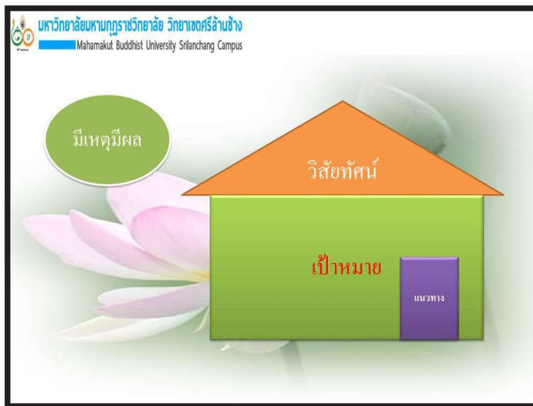
แผนภาพที่ 3 แสดงความสัมพันธ์ของวิสัยทัศน์ เป้าหมาย และแนวทางการดำเนินชีวิต

เมื่อมีเป้าหมายทั้งระยะสั้น และเป้าหมายระยะยาวที่เป็นวิสัยทัศน์แล้ว สิ่งสำคัญที่จะทำให้ภาพฝันเป็นจริงคือ ทางเดินไปสู่ฝันที่เรียกว่า “แนวทางการดำเนินชีวิต” เพราะถ้าขาดแนวทางการดำเนินการแล้ว ภาพฝันก็จะกลายเป็นความฝันเท่านั้นเอง