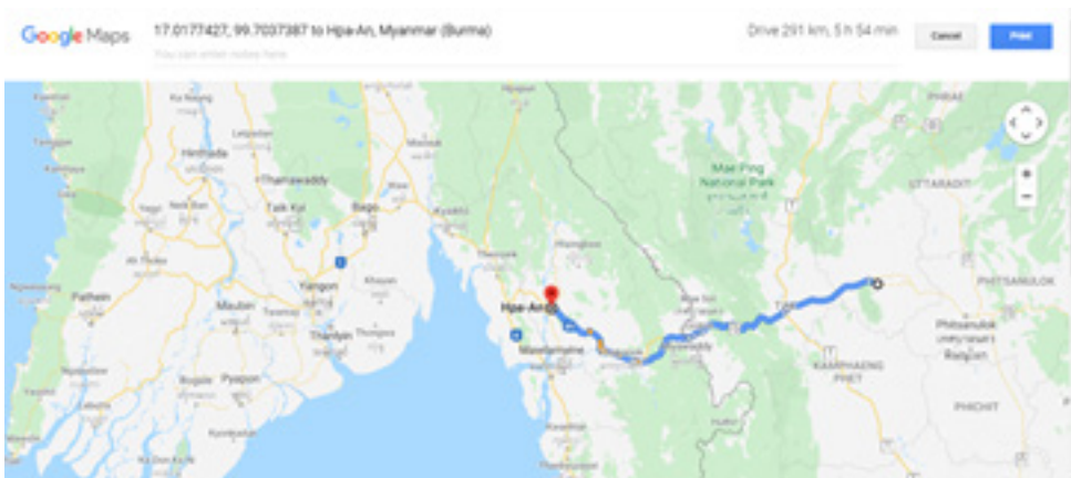
เส้นทางจากเมืองพะอ้นถึงสุโขทัย

ตามตำนานกล่าวว่า พระมหาสุมนเถระนั้นเป็นพระที่ได้บวชแปลงในสำนักของพระอุทุมพรมหาสวามีแห่งเมืองนครพันซึ่งคือเมืองพะอ้น (Hpa-an) ใกล้เมืองมะละแหม่งในพม่าปัจจุบันที่อยู่ห่างจากสุโขทัยเพียง 300 กม. พระอุทุมพรมหาสวามีได้ไปศึกษาและเข้ารับการอุปสมบทใหม่ในสำนักอุทุมพรคีรีในประเทศศรีลังกา