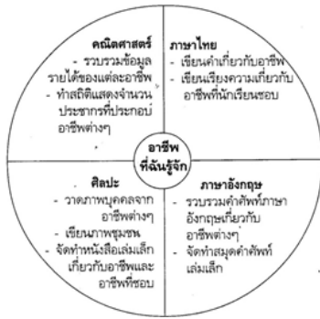
แผนภูมิที่ 2

4. วางแผนออกแบบกิจกรรมการเรียนรู้ในแต่ละกลุ่มประสบการณ์อย่างเหมาะสมและสัมพันธ์กัน ดังแผนภูมิที่ 2 และ 3 (กรณวิชาการ 2542: 230-231)