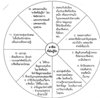
แผนภูมิที่ 3

จากตัวอย่างการจัดกิจกรรมการเรียนการสอนแบบบูรณาการดังกล่าวข้างต้น จะเห็นได้ว่า เป็นกิจกรรมที่เน้นผู้เรียนเป็นสำคัญ กล่าวคือ นักเรียนได้ลงมือปฏิบัติ ได้ทำแผนผังความคิด ได้รวบรวมข้อมูล ได้สัมภาษณ์วิทยากร ได้จัดนิทรรศการ และได้ทำกิจกรรมที่เชื่อมโยงไปยังวิชาอื่น ๆ เช่น เขียนเรียงความ สัมภาษณ์วิทยากร (ภาษาไทย) ทำสถิติอาชีพต่าง ๆ (คณิตศาสตร์) รวบรวมคำศัพท์เกี่ยวกับอาชีพ (ภาษาอังกฤษ) ทำให้นักเรียนได้รับความรู้แบบองค์รวมและเป็นความรู้ที่มีความหมายต่อชีวิต จึงกล่าวได้ว่า การสอนแบบบูรณาการเป็นการสอนแบบหนึ่งที่จะช่วยพัฒนาให้ผู้เรียนเป็นคนเก่ง ดี มีสุข ได้ตามเป้าหมายของการจัดการศึกษา