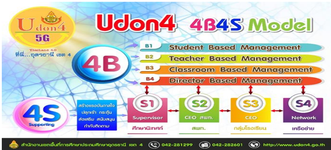
ภาพที่ 2 แสดงรูปแบบองค์ความรู้