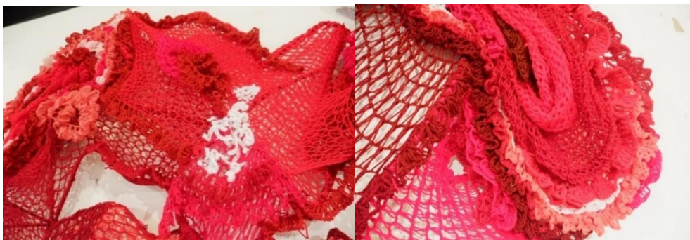
ภาพที่ 3 ผลงานสร้างสรรค์

ชื่อผลงาน รูปทรงแห่งความเป็นแม่ ขนาด กว้าง 200 ยาว 40 สูง 200 เซนติเมตร เทคนิค ผสม