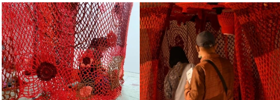
ภาพที่ 2 ผลงานสร้างสรรค์

ชื่อผลงาน พื้นที่แรกแห่งรัก ขนาด กว้าง 270 ยาว 270 สูง 230 เซนติเมตร เทคนิค สื่อผสม (ที่มา: ผลงานสร้างสรรค์โดยผู้สร้างสรรค์ ณ มหาวิทยาลัยมหาสารคาม อำเภอกันทรวิชัย จังหวัดมหาสารคาม เมื่อ 9 เมษายน 2564)