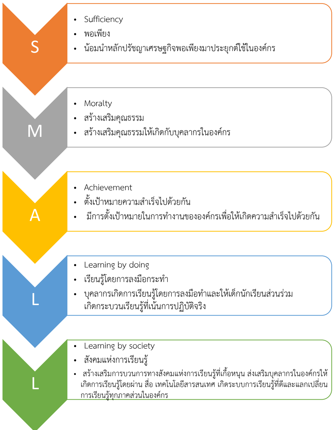
ภาพที่ 2 องค์ความรู้การบริหารงานวิชาการโรงเรียนขนาดเล็กในกลุ่มพัฒนาคุณภาพการศึกษาที่ 4 ลุ่มน้ำยัง สังกัดสำนักงานเขตพื้นที่การศึกษาประถมศึกษาร้อยเอ็ด เขต 3