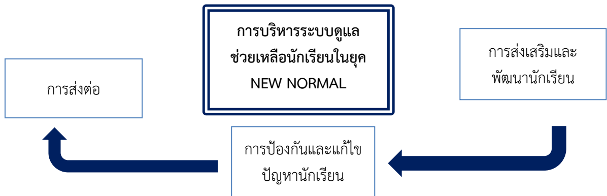
ภาพที่ 1 องค์ความรู้การบริหารระบบดูแลช่วยเหลือนักเรียนในยุค NEW NORMAL โรงเรียนขนาดเล็กในกลุ่มพัฒนาคุณภาพการศึกษาที่ 4 กลุ่มน้ำยังสังกัดสำนักงานเขตพื้นที่การศึกษาประถมศึกษาร้อยเอ็ด เขต 3